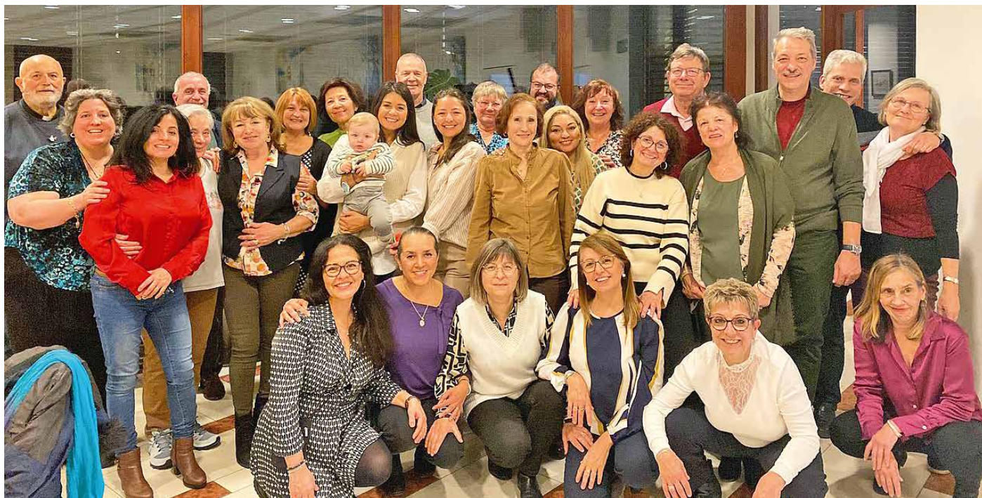
Le groupe des catéchistes de l'UP, 2 février 2024.

PAR MARIE-LAURE DUPONT, EN COLLABORATION AVEC JEANNE-MARIE TRÉBOUL